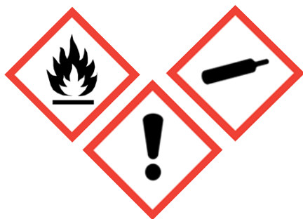
Etiqueta de Transporte